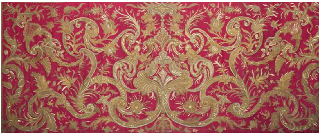
Frontal de altar (detalhe); Roma, século XVIII; PNA57419