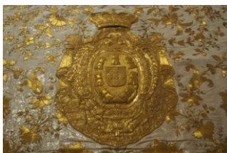
Pano de armar