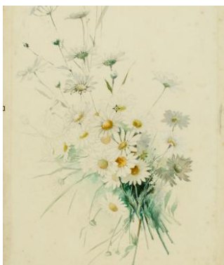
D. Maria Pia, aguarela sobre papel.