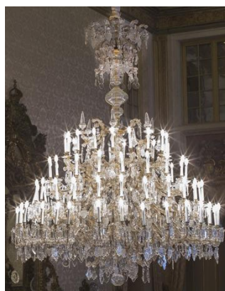
Lustre da Sala dos Jantares Grandes